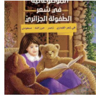
الموضوعاتية في شعر الطفولة الجزائري