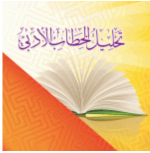
تحليل الخطاب الأدبي