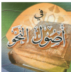
في أصول النحو دج 327.00 (9961-66-870-7)