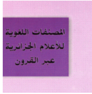
المصنفات اللغوية للإعلام الجزائرية