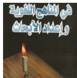
في المناهج اللغوية و إعداد الأبحاث دج 296.40 (9961-66-894-8)