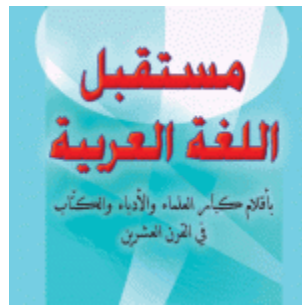
مستقبل اللغة العربية