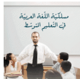
مسلكية اللغة العربية في التعليم المتوسط