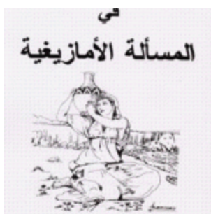
في المسألة الأمازيغية دج 277.00 (9961-66-361-6)