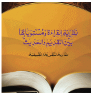
نظرية القراءة و مستوياتها بين القديم و الحديث