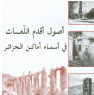
أصول أقدم اللغات في أسماء أماكن الجزائر