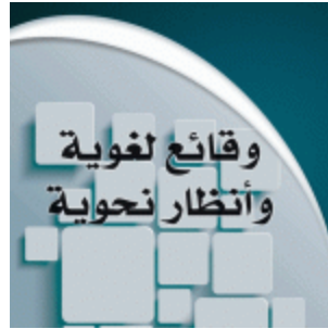
وقائع لغوية وأنظار نحوية