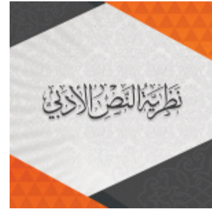
نظرية النص الأدبي