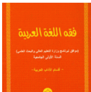
فقه اللغة العربية 1 جامعي دج 265.20 (9961-66-322-5)