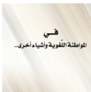
في المواطنة اللغوية و أشياء أخرى دج 424.34 (9961-65-236-7)